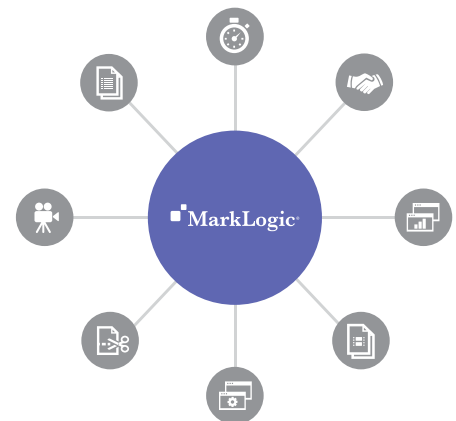
Solution de hub de données de MarkLogic